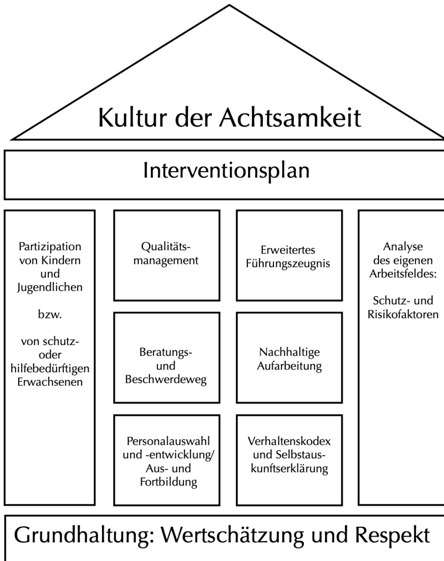
Grafik angelehnt an das Schaubild der Präventionsstelle des Erzbistums Köln